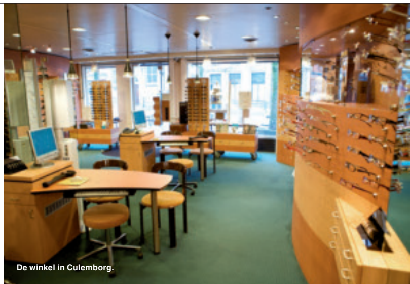
De winkel in Culemborg.