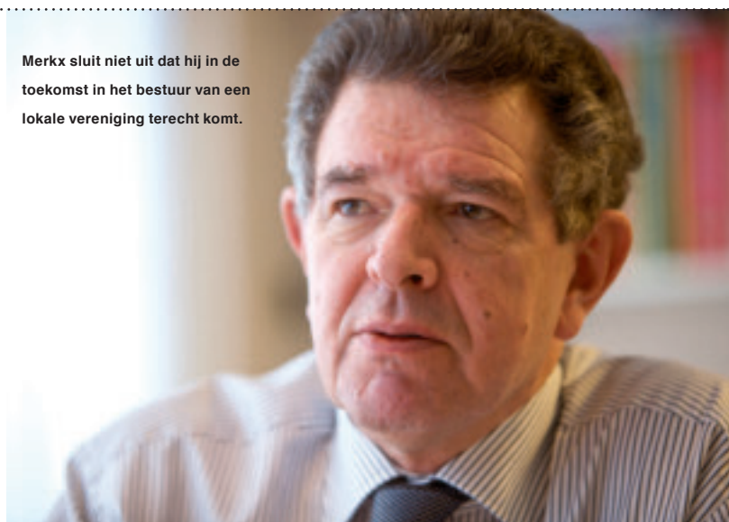
Merkx sluit niet uit dat hij in de toekomst in het bestuur van een lokale vereniging terecht komt.